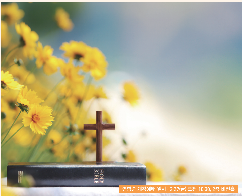
연합순 개강예배 일시 : 2.27(금) 오전 10:30, 2층 비전홀

내가 네게 명령한 것이 아니냐 강하고 담대하라 두려워하지 말며 놀라지 말라 내가 어디로 가든지 네 하나님 여호와가 너와 함께 하느니라 하시니라 (수19)